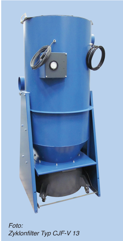
Foto: Zyklonfilter Typ CJF-V 13