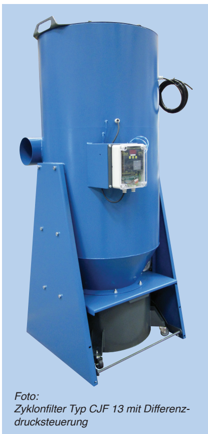
Foto: Zyklonfilter Typ CJF 13 mit Differenzdrucksteuerung

Filtergehäuse ist in 2mm schwarzer Stahlplatte aufgebaut Oberfläche pulverlackiert RAL 5007/7011 Struktur