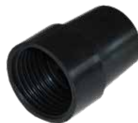
Foto: Schraubmuffe Typ MUHO

Sehen Sie auch die Prospektseite für Zubehör für Schlauchaufroller Typ HOSR!